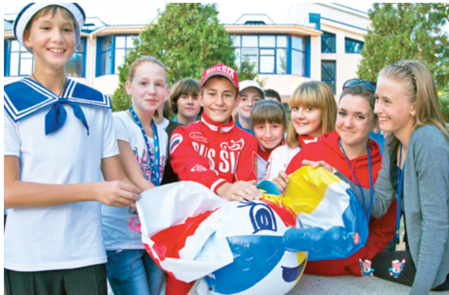
Образцовый вокальный коллектив «Алфавит». Мамонтоша