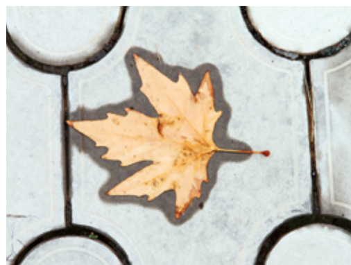
Признак осени.