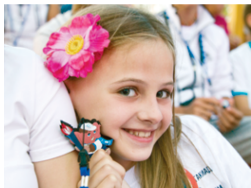
Красота! Автор — Владимир БОЙКО