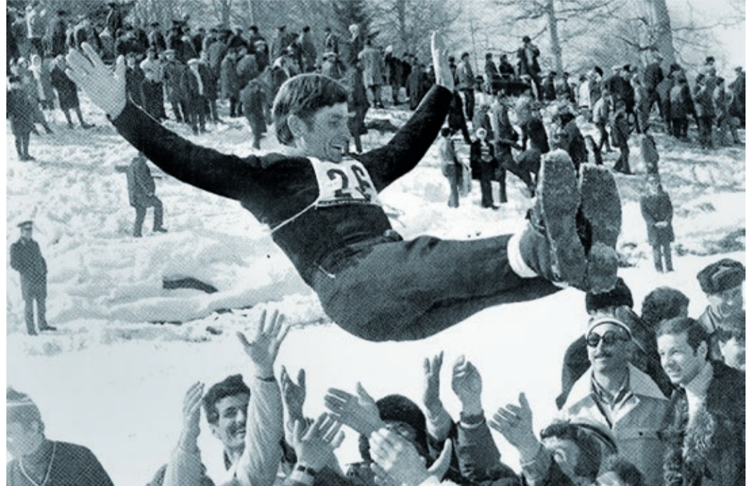
Столица Урала более полувека принимает масштабные спортивные мероприятия.

История среднеуральского спорта пестрит яркими страницами. Ведь Екатеринбург по праву считается одним из ведущих спортивных центров России. Начиная с 1952 года, когда Советский Союз вошел в олимпийскую семью, наши земляки завоевали на Играх около 140 медалей, треть из которых — золотые. Так что Урал не только опорный, но еще и спортивный край державы.