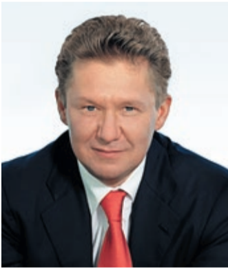
Председатель Правления ПАО «Газпром» А.Б. Миллер

Желаю участникам Спартакиады настрою на победу, а зрителям — незабываемых впечатлений!