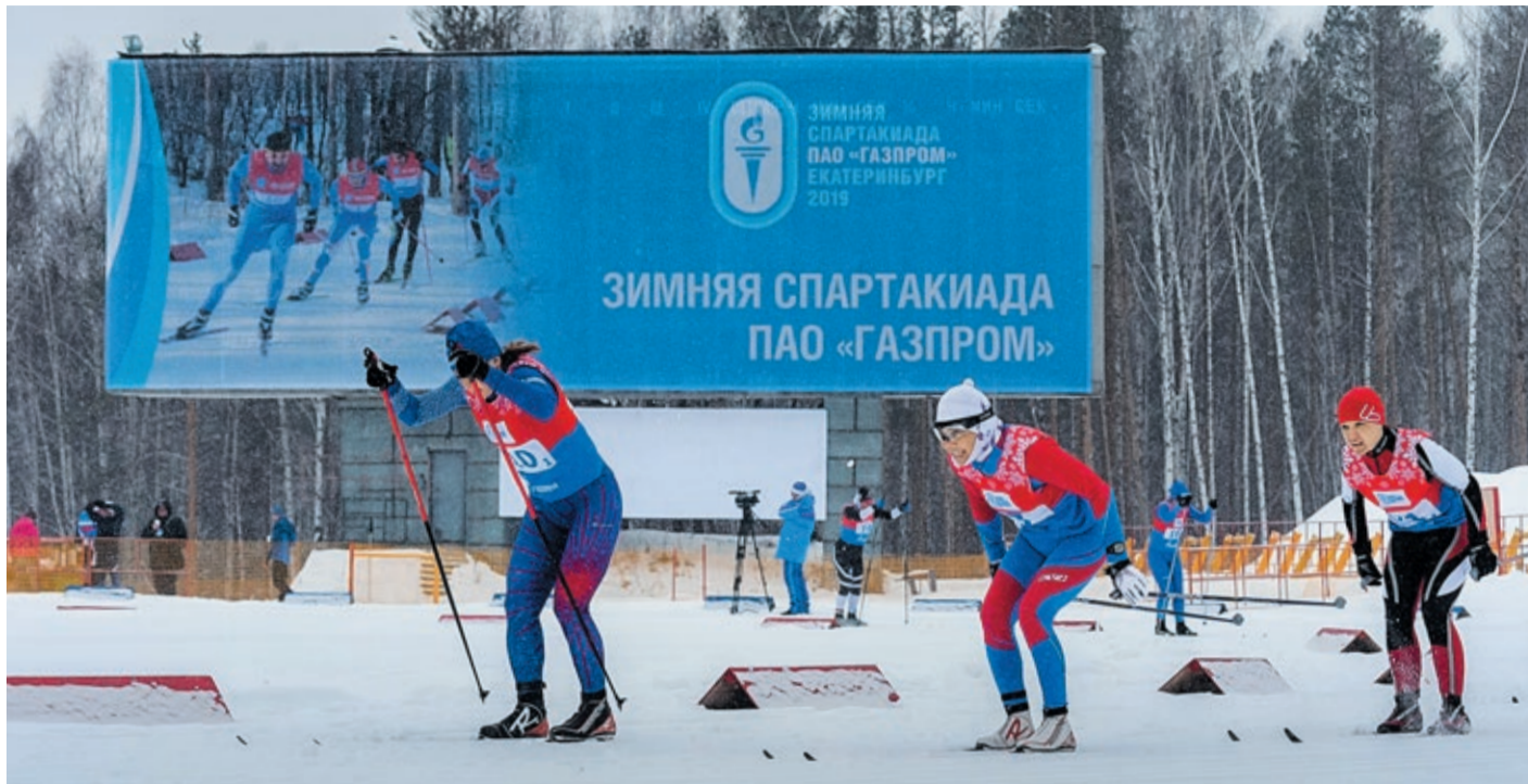
Спортивная летопись «Газпрома» включает уже 25 Спартакиад: 13 прошли летом и 12 — зимой

На неделю с 13 по 20 марта 2024 года Екатеринбург вновь станет спортивной столицей отечественных газовиков. Из разных регионов России, а также из Беларуси на Средний Урал съедутся более двух тысяч работников из дочерних обществ и организаций энергетической компании, чтобы принять участие в традиционном корпоративном мероприятии — Спартакиаде ПАО «Газпром».