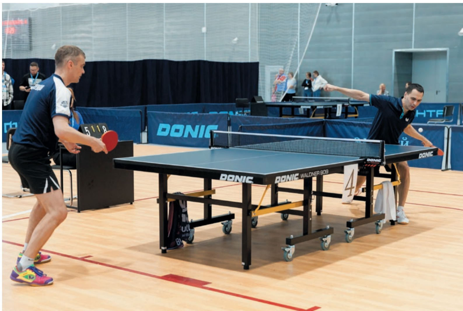
Спартакиада попрощалась с одним из самых народных видов спорта — настольным теннисом. Вчера завершился турнир в личном зачете у мастеров малой ракетки.