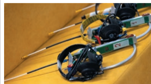
ШАХМАТЫ НА БЕГУ Студенты выступили в роли охотников на лис стр. 7