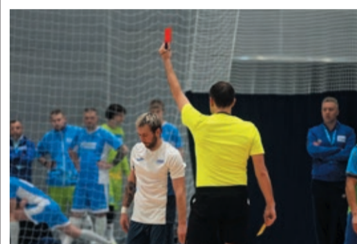
БЕЗ ПРАВА НА ОШИБКУ Подвиги по расписанию в мини-футболе стр. 4