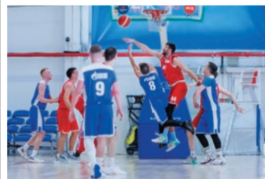
ДЛЯ ВСЕХ НАЙДЕТСЯ МЕСТО Баскетболисты начали игру на выбывание стр. 5