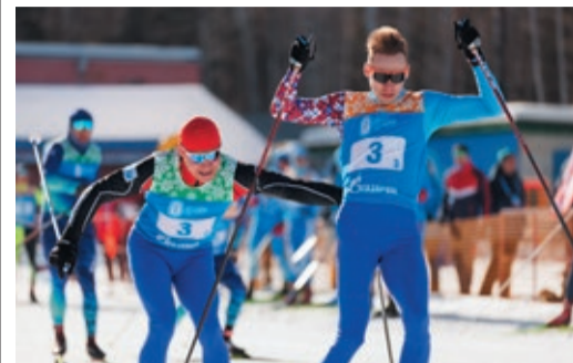
САМЫЙ ЛЫЖНЫЙ ДЕНЬ! Программа лыжников завершилась яркими эстафетами стр. 2