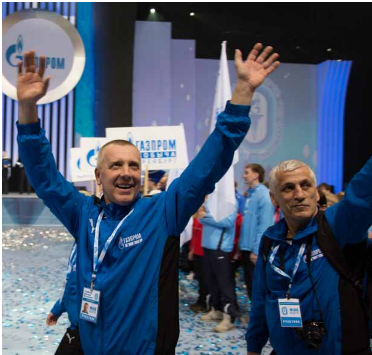
Участники Спартакиады разыграют более ста комплектов наград.

- В каждой дочерней компании идет жесткий отбор участников для участия в Спар-