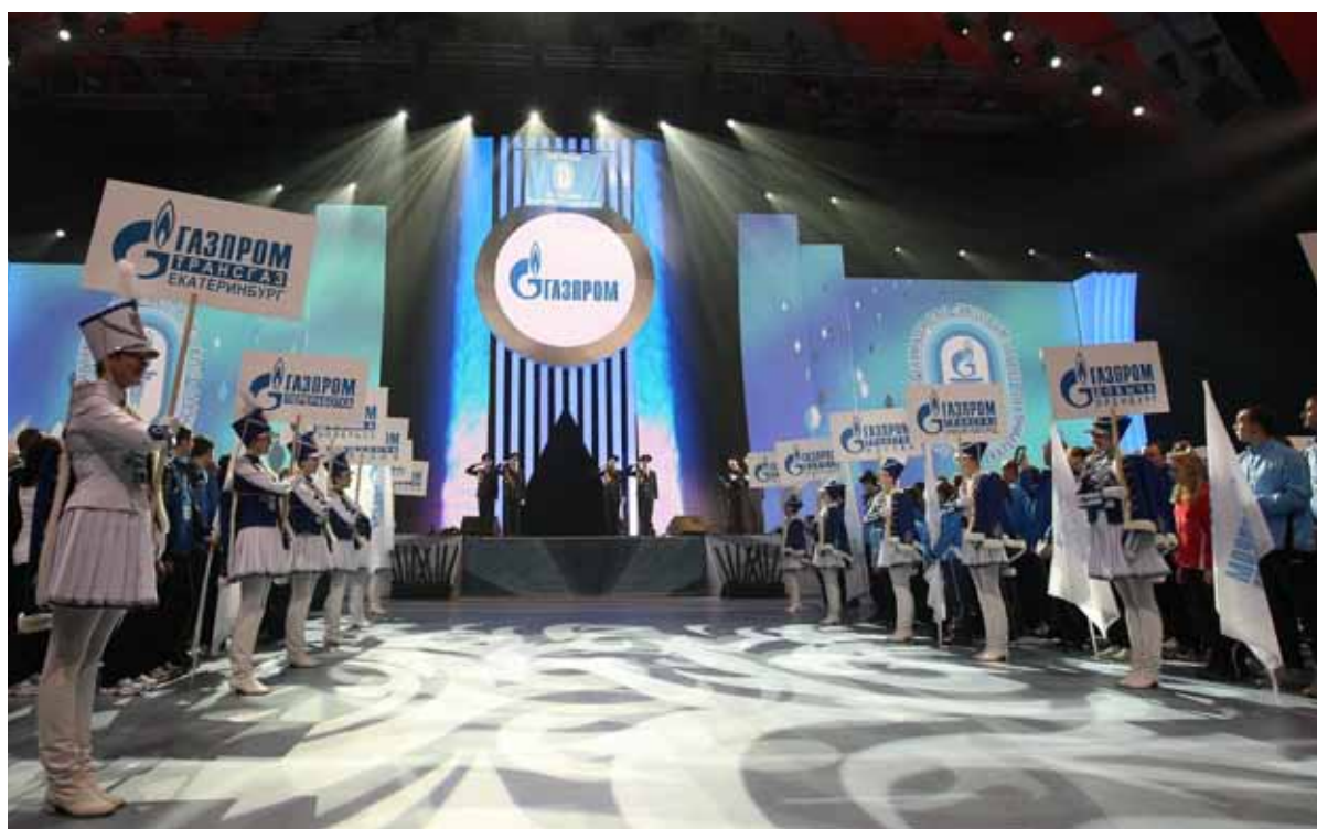
Флаг Спартакиады был торжественно поднят под сводами Дворца игровых видов спорта «Уралочка».

Алексей ЗАЯКИН На правах рекламы